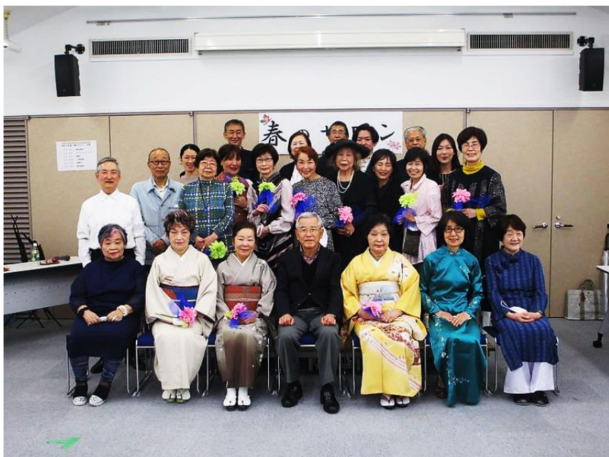
久しぶりにマスクを外して全員で「ハイ、チーズ」