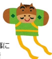
上落合地域交流館 職員一同

本年も体操・軽スポーツ・手芸・麻雀など私たちの得意分野でさらに充実した事業とし、利用者の 健康生活に貢献できるよう頑張りますので本年もご支援よろしくお願いいたします。