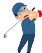
早稲田南町地域交流館

「おはようございます！」私はこの言葉が大好きです。そして大切にしてきた言葉です。 今日も朝を迎えることが出来ましたよ。嫌なこともあるかもしれないけれど一日が始まりますよ。も ちろんこんなことを考えながら口に出している訳ではありませんが、それは時間がなくて慌ててい ても、気まずい時間であっても「おはようございます」からスタートです。2025 年は 2 週間ほど歩行 すらままならず利用者さんはもちろんスタッフの皆に助けて貰い、椅子に座っているだけの私に「お はようございます。今日は●●さん代わりに行くからね」と言ってもらい感謝でした。 <飛躍>これが今年のテーマですが 2026 年私たちはまずは<向上> かと思います。